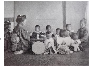
大正4年ごろの 食事風景