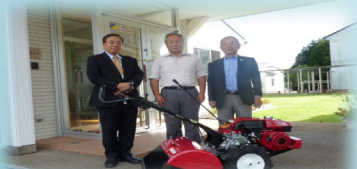
宇都宮市 陽東ローターリークラブ様より頂きました。