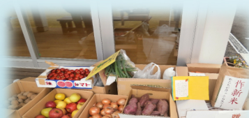
宇都宮市 作新学院中部のみなさんより頂きました