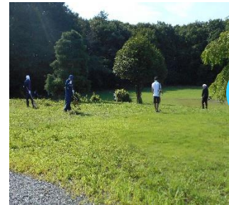
菱電商事さん、東京応化工業さん(環境美化)、日本コークス販売さん(バーベキュー大会)酷暑の中、毎年のご支援ありがとうございました!