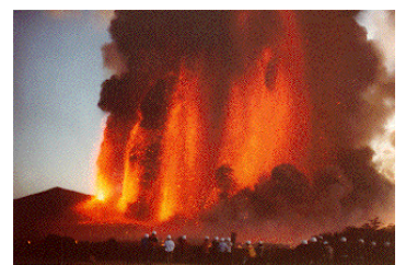
<伊豆大島三原山の噴火>

*ポンペイ…イタリア南部のベスビオ火山のふもとにあった都市。西暦79年の同火山の噴火で発生した火砕流によって、ポンペイの街と人を一瞬のうちに焼き尽くした。