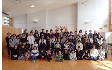
令和6年度 下野三楽園 卒園生を送る会 令和7年3月8日